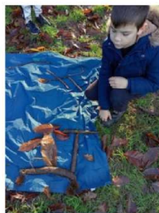
le cycliste de Timéo T.