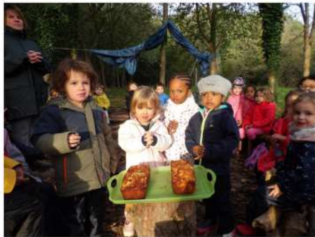
Fêter les anniversaires