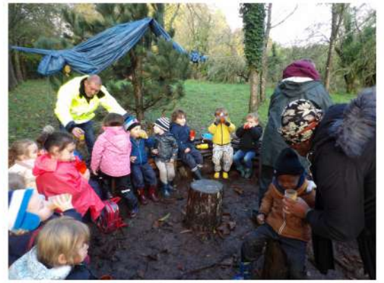
Se réchauffer avec la soupe de courge du jardin