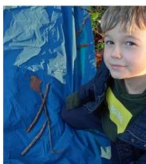
le gymnaste de Sylas