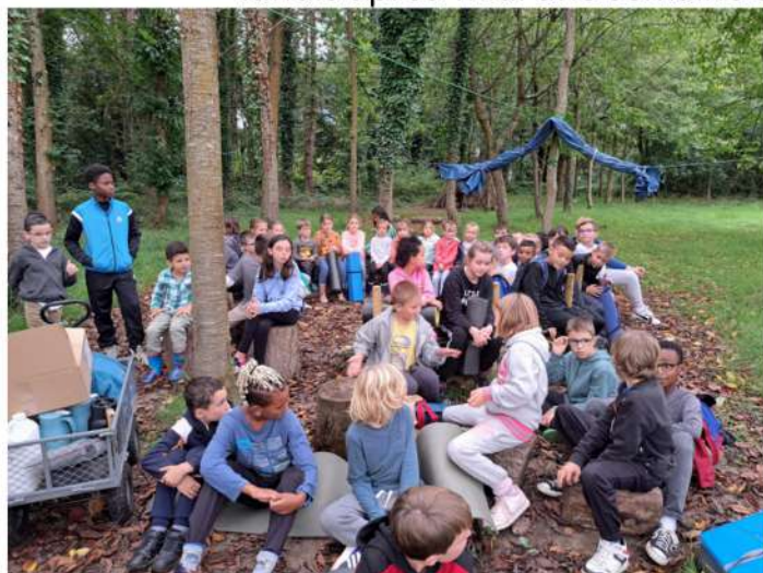
Nous partageons des moments avec les grands comme le rappel des règles lors de la première séance ...

La classe de CP/CE1 a également commencé à explorer le terrain de l'école à ciel ouvert mais de façon entrecoupée à cause des séances de piscine. A partir de janvier, nous nous y rendrons les lundis après-midi une semaine sur deux avec la classe de CM1/CM2.