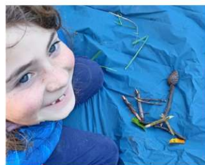
le skieur de Romy