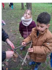
Comme la création de sapin avec des morceaux de bois et de la laine...