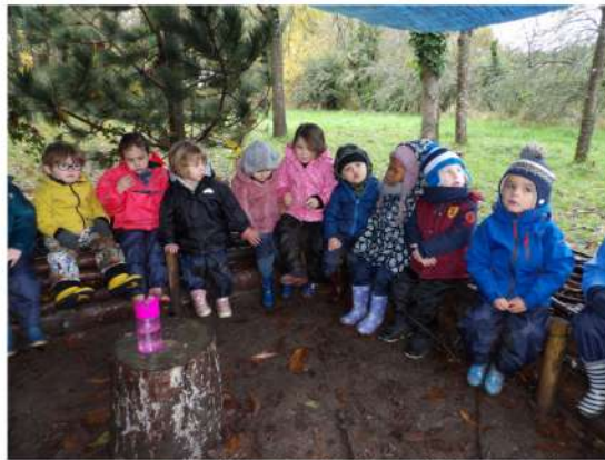
Ecouter le bruit de la pluie sur la bâche