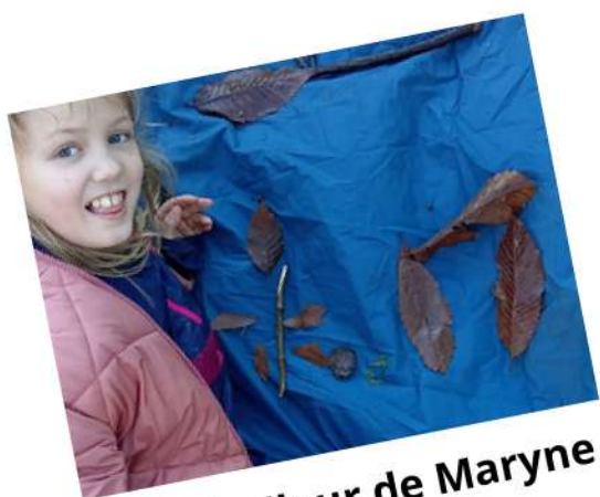
le footballeur de Maryne

Nous avons associé notre thème de classe "les Jeux Olympiques" au travail dehors : les enfants ont eu à représenter, à l'aide de matériaux naturels, un sport olympique :