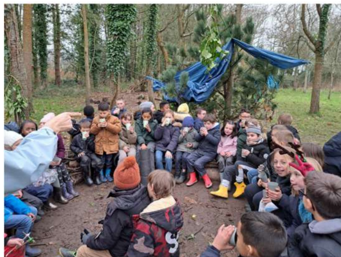
Comme la dégustation d'une tisane...