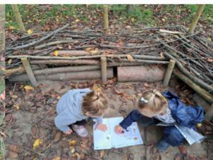
On se trouve un coin tranquille pour faire des exercices de manipulation par petits groupes.

On crée des personnages avec son ombre et des éléments du visage préparés en classe.