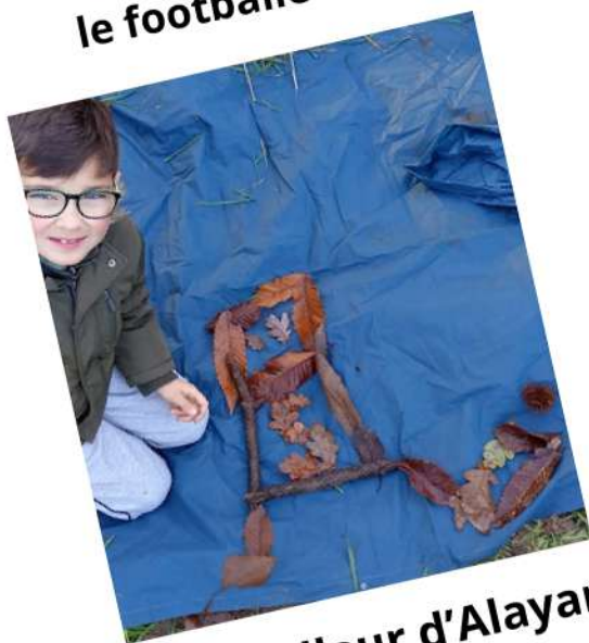
le footballeur d'Alayann