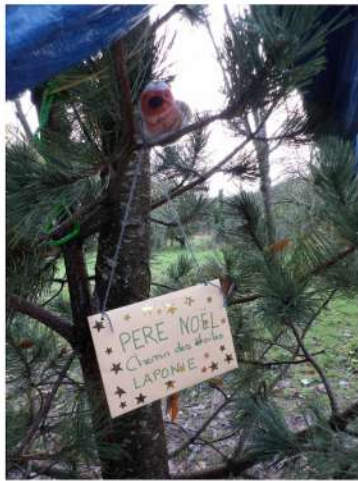
Confier une lettre à Robin pour le Père Noël