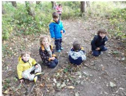
Ecouter la nature