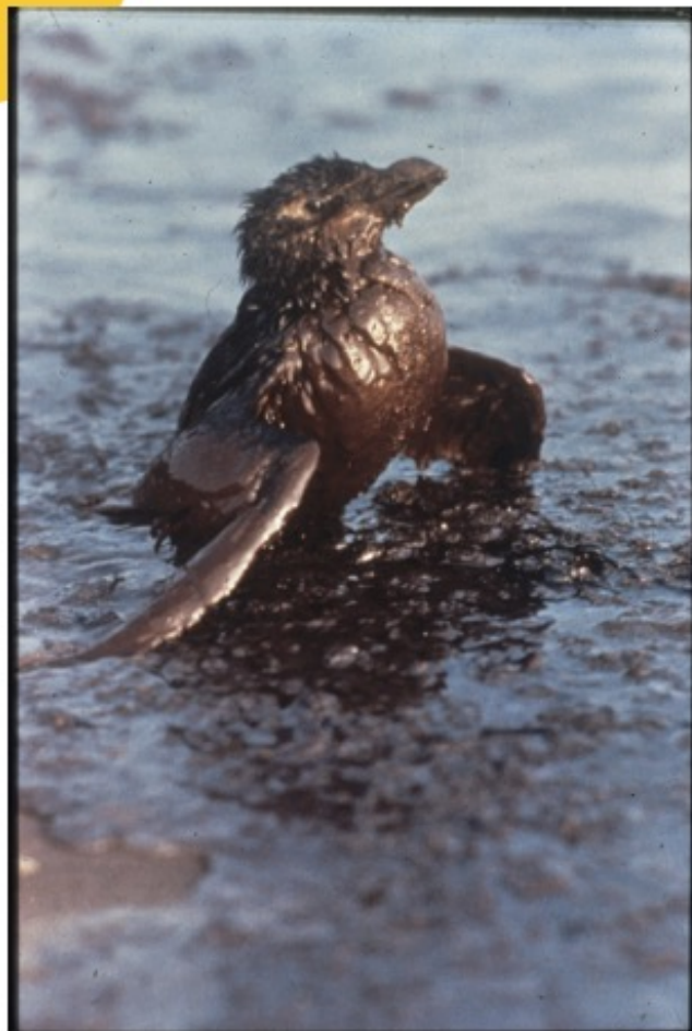
Pingouin Torda mazouté. Collection particulière.