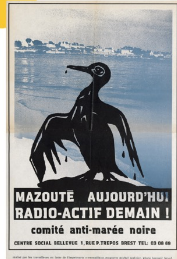
"Mazouté aujourd'hui, radio-actif demain !" Arch. Dép. d'Ille-et-Vilaine, 296 J 7.