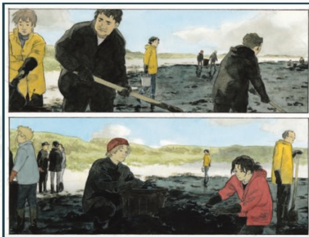
Bleu Pétrole, page 44, Morizur et Montgermont, 2017.