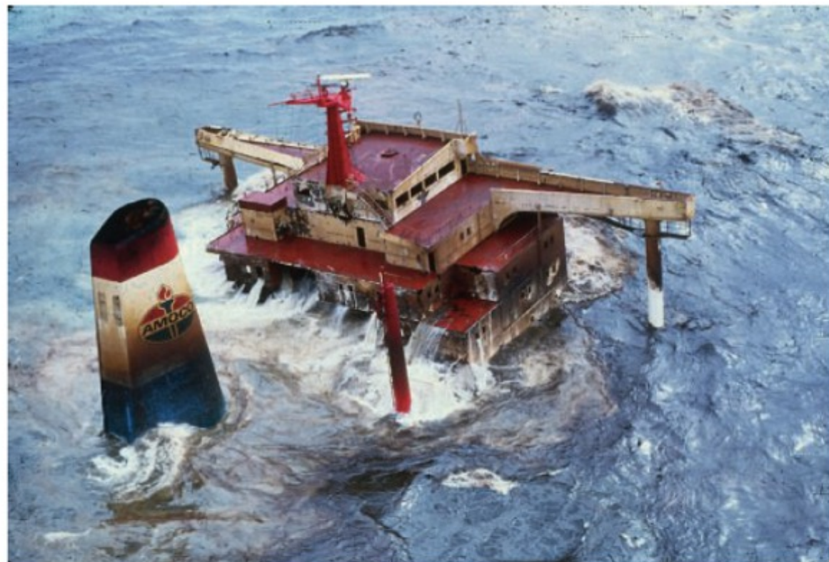
Le « château » de l' Amoco englouti par les flots.