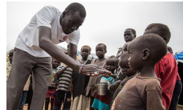
Soudan du sud