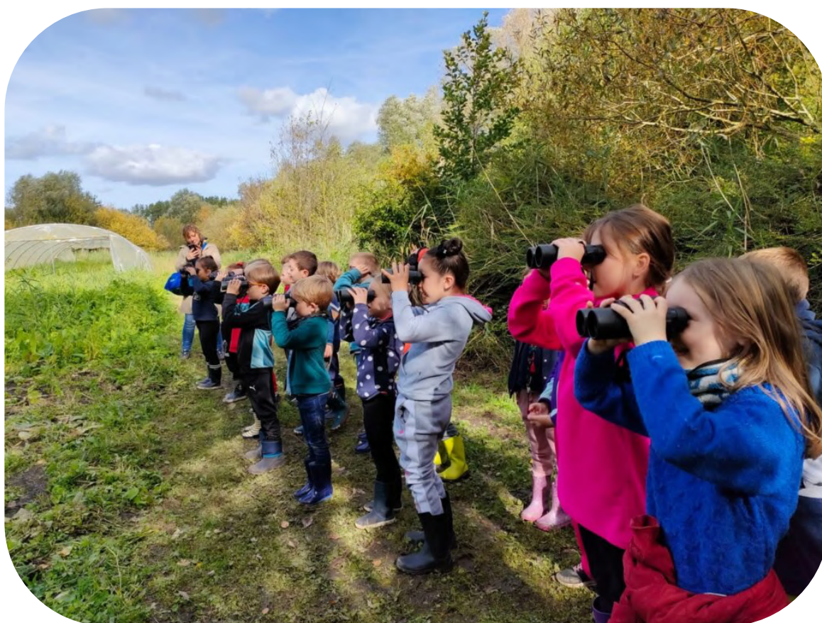
Sortie nature avec la LPO Pas-de-Calais